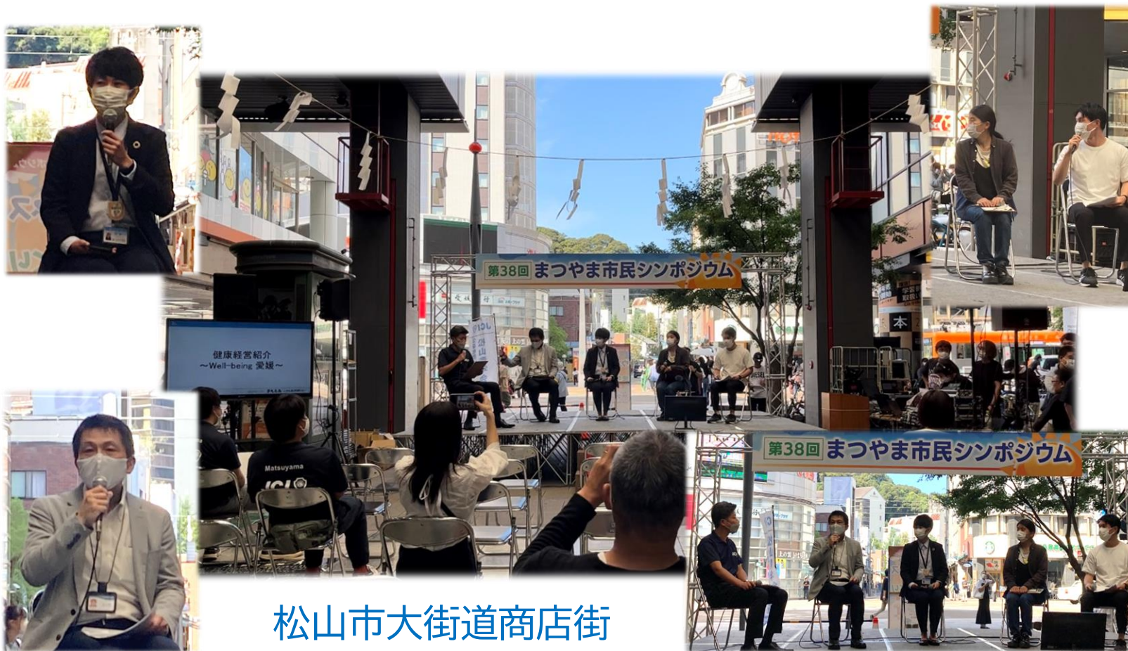
松山市大街道商店街