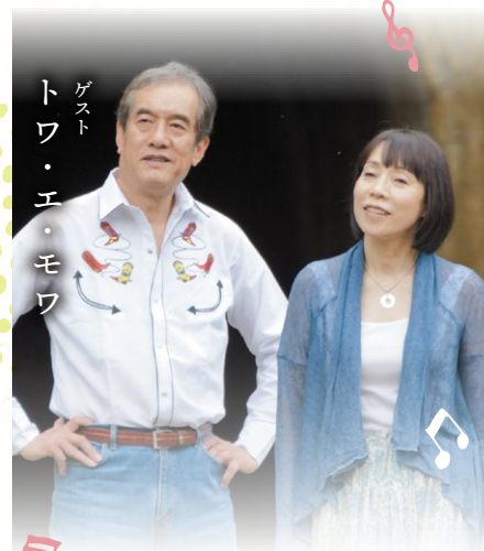
ゲスト トワ・エ・モワ