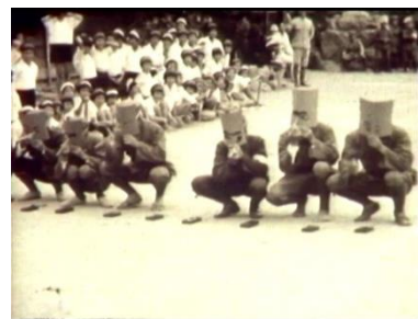
経済更生! 旧・佐礼谷村(昭和15年)