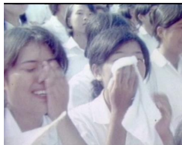
夏将軍、伝説の決勝戦(昭和44年)