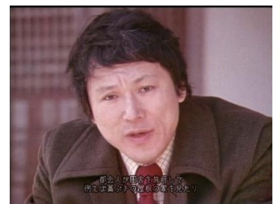
失われた、ふるさと～伊丹十三～