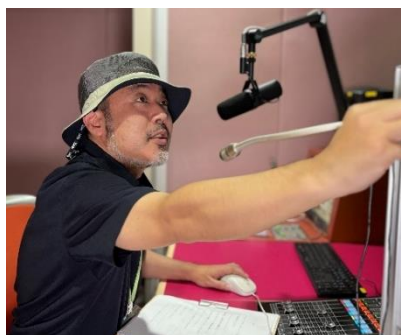
企画・構成 岩城一平氏

【この件に関するお問い合わせ】 南海放送サービス (担当 三好) TEL 089-945-0010(平日 9:00~17:00) E-MAIL info@es.rnb.co.jp