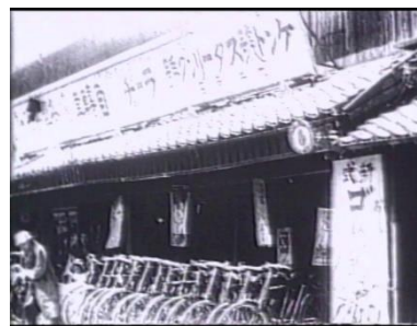
旧・久万町～大正時代の街道