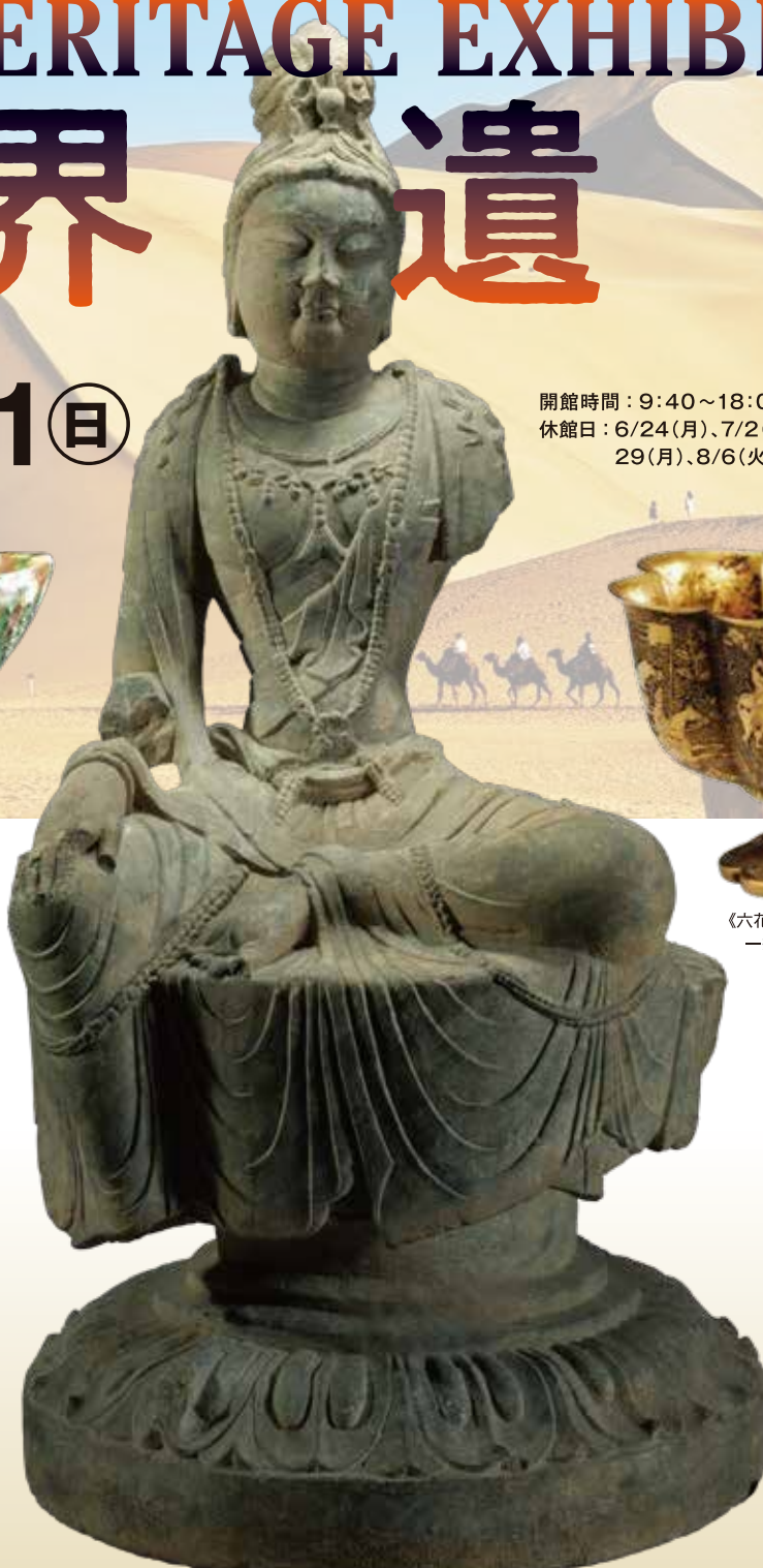
《菩薩坐像》唐・7-8世紀/2000年洛陽市奉先寺遺跡出土/一級文物/龍門石窟研究院

四国内での開催は唯一！ 一級文物44点を含む シルクロードの遺宝 約200点が、愛媛に。