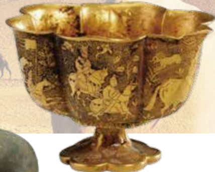
《六花形脚付杯》唐・8世紀 一級文物/山西博物院