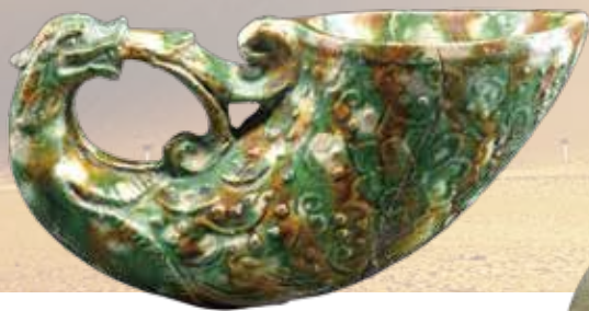
《鳳首杯》唐・8世紀/1982年西安市韓森寨出土 一級文物/陝西歷史博物館

開館時間：9:40~18:00(展示室入場は17:30まで) 休館日：6/24(月)、7/2(火)、8(月)、16(火)、22(月)、 29(月)、8/6(火)、13(火)、19(月)、26(月)