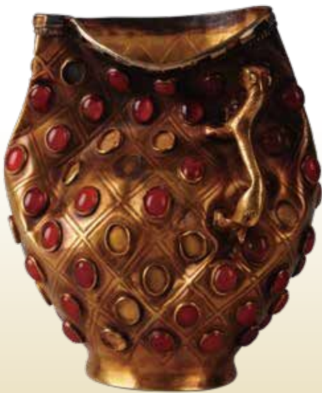
《瑪瑙象嵌杯》5-7世紀/1997年イリ州昭蘇県ボマ古墓出土 一級文物/イリ州博物館